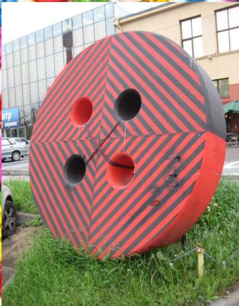
Раскатившиеся памятники пуговицек из камня и гранита. (Клаунас, Литва.)