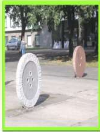
Памятник пуговице (Литва)